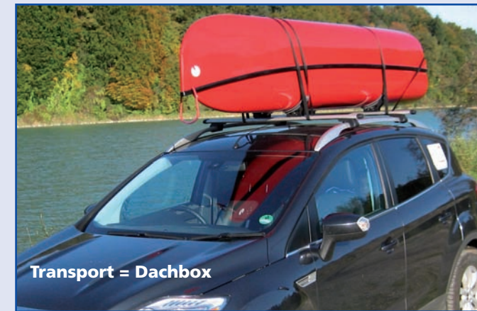
Transport = Dachbox