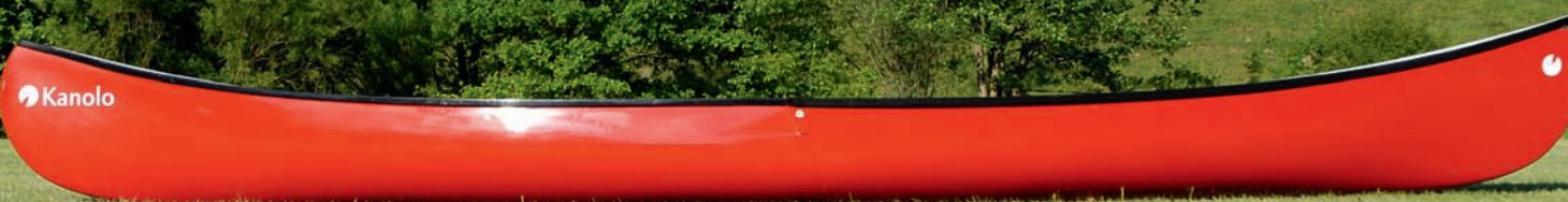
Aufgeklappt als Boot