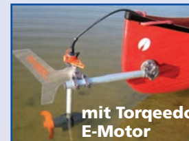
mit Torqeedo E-Motor