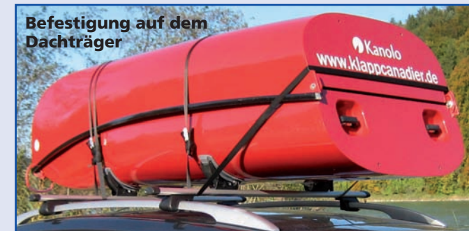
Befestigung auf dem Dachträger